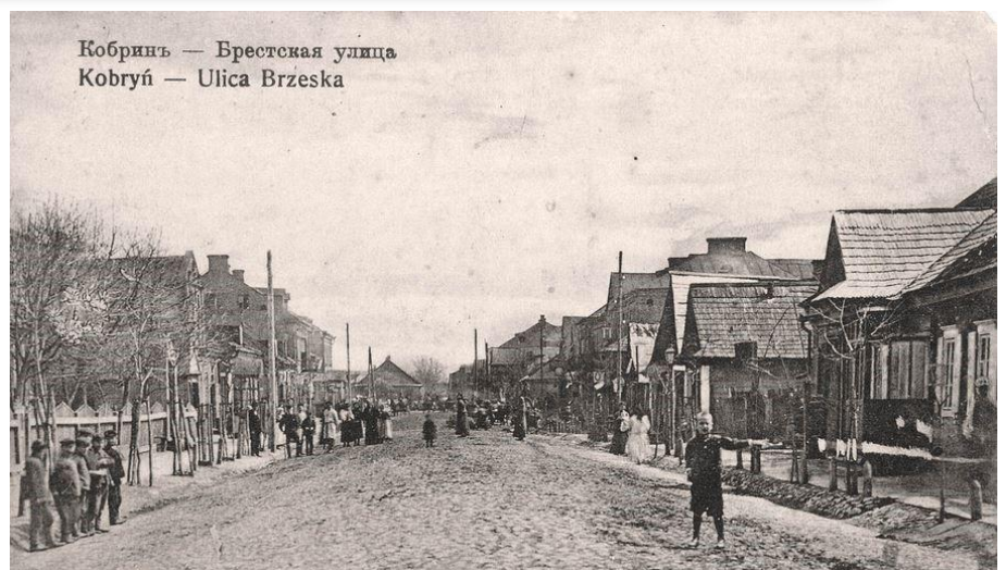
Кобринъ — Брестская улица Kobryn — Ulica Brzeska