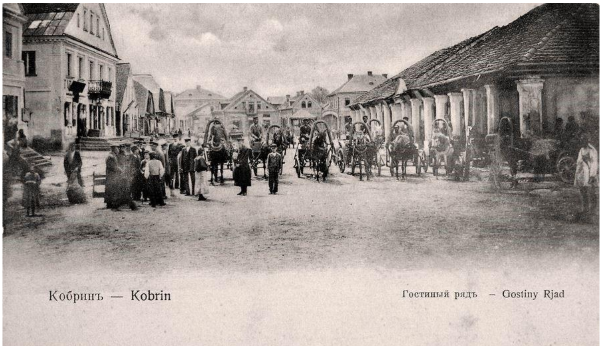
Кобринъ — Kobrin